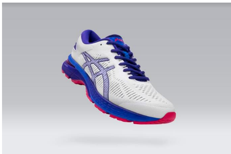
GEL-KAYANO 25（提供：株式会社アシックス様）

このたび、星光PMC株式会社のセルロースナノファイバー（CNF）複合材料“STARCEL®”が総合スポーツ用品メーカーである株式会社アシックス様の高機能ランニングシューズ製品「GEL-KAYANO 25（ゲルカヤノ 25）」のミッドソール部材の原材料の一部に採用されました。GEL-KAYANOシリーズは、25年に渡り世界のランナーから注目され、愛され続けてきたランニングシューズです。GEL-KAYANO 25のミッドソール（甲被と靴底の間の中間クッション材）には軽量性と耐久性という相反する機能を高次元で両立させた新たなスポンジ材「FlyteFoam Lyte（フライトフォームライト）」が使われており、この原材料の一部にCNF複合材料“STARCEL®”が使用されています。株式会社アシックス様の発泡成形技術と当社のSTARCEL®製造技術のコラボレーションにより、世界初のCNF強化樹脂応用製品の商品化が実現しました。